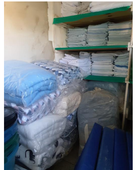
Guarda de roupas de cama.

ESTE DOCUMENTO FOI ASSINADO EM: 11/07/2023 12:53 -03:00 -03 PARA CONFERÊNCIA DO SEU CONTEÚDO ACESSAR: https://ic.atende.net/tp64ad7af1ab737 . POR MILENA SILVA DE JESUS - (311.025.258-98) EM 11/07/2023 12:53