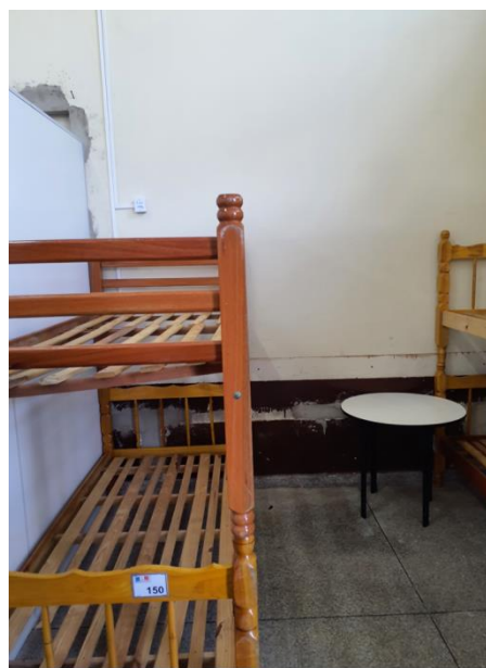
Dormitório coletivo feminino.