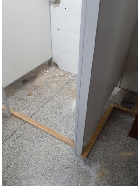
Sistema de contenção de água.