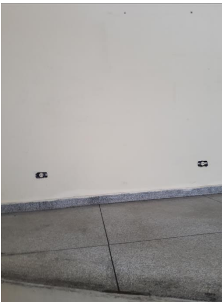
Tomadas sem espelho.