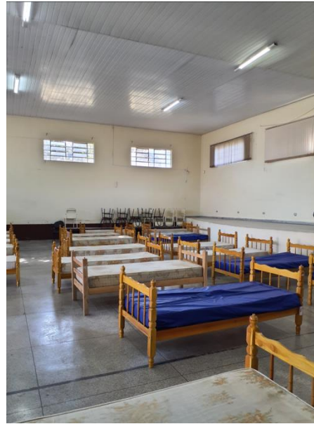
Dormitório coletivo, colchão em tecido.