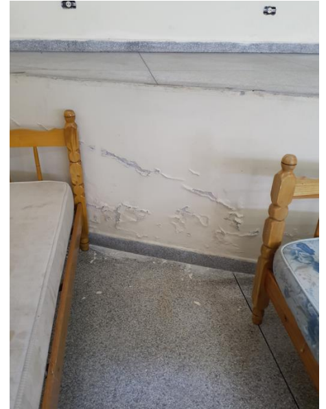
Parede com revestimento danificado.