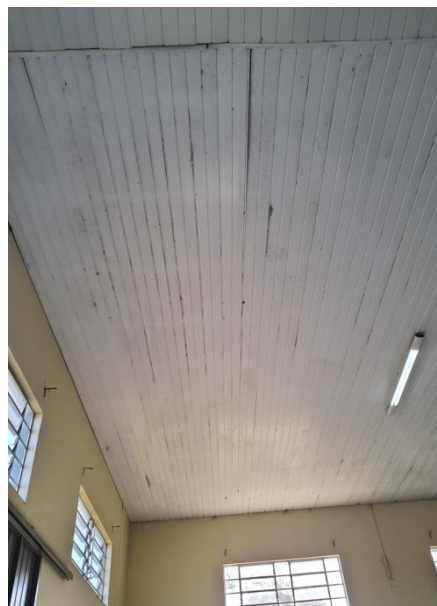
Forro com sujidades.

ESTE DOCUMENTO FOI ASSINADO EM: 11/07/2023 12:53 -03:00 -03 PARA CONFERÊNCIA DO SEU CONTEÚDO ACESSSE https://ic.atende.net/tp64ad7af1ab737 . POR MILENA SILVA DE JESUS - (311.025.258-98) EM 11/07/2023 12:53