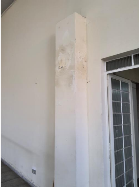
Parede com infiltração.

Departamento de Vigilância Sanitária, Ambiental e Saúde do Trabalhador