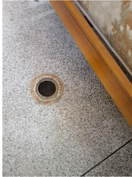
Buraco no piso.