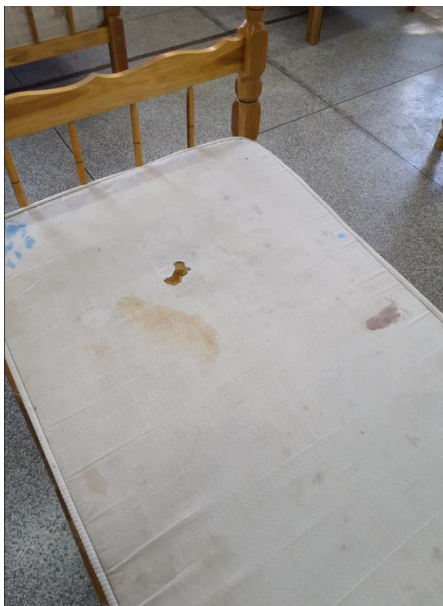
Colchão em tecido, com rasgo.