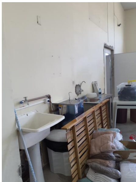
Área de serviço.